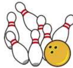
スポーツイベント