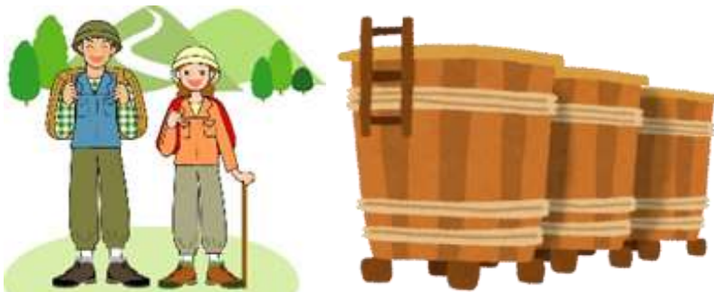
登山・ハイキング 酒蔵巡り